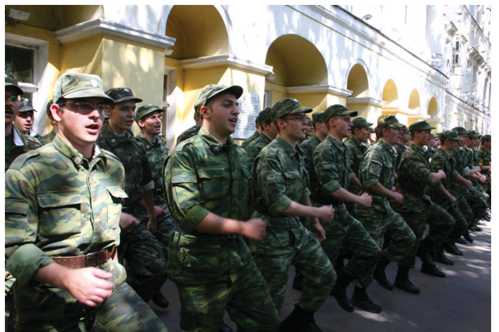
«С места, с песней шагом марш!»

Нам, конечно, показали разную военную технику, сводили на стрельбы. Удалось и из автомата пострелять, и гранаты учебные