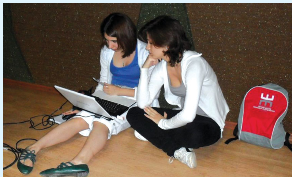
Вот так и работали в условиях, приближенных к полевым

В Летней школе собрались представители разных народов, но все словно породнились. Здесь даже появились донецкий Ромео и московская Джульетта. Хотя, возможно, влюбленных здесь гораздо больше, о них просто не знает автор этой статьи. Было совершенно неважно, что правительства стран-участников ведут свою игру, порой жесткую, порой дружелюбную. Здесь, в Школе, это не имело никакого значения – ведь просто собрались люди, влюбленные в журналистику.