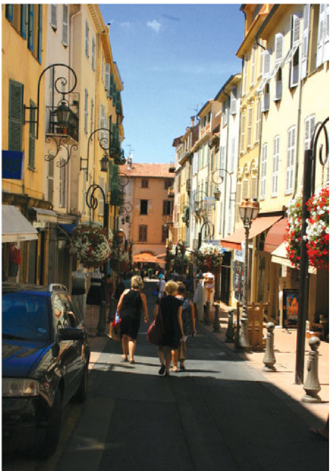
Дыхание старины глубокой в каждом камне

Две недели пролетели незаметно, но оставили самые яркие впечатления. По окончании обучения всем выдали сертификаты.