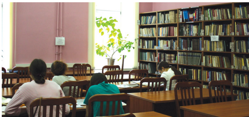
В одном из читальных залов

Учебную литературу, которую трудно достать на московских прилавках, вы можете получить в библиотеке нашего университета или приобрести в небольшом магазинчике, который для удобства студентов находится в холле на первом этаже. К слову сказать, в нашей библиотеке студенты могут прочитать интересные работы преподавателей МГЛУ и воспользоваться учебниками и пособиями, написанными под их руководством или редакцией, что облегчит в дальнейшем сдачу сессии и улучшит знание того или иного предмета.