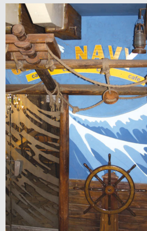
Old Navy манит оригинальным интерьером

Правда, в наших кафе и столовых бывают не только приятные моменты, но случаются и инциденты. Иные нерадивые студенты путают столовые с читальным залом. Занимая столы не по назначению, студенты не дают возможности товарищам подкрепиться. В итоге нередко можно увидеть молодых людей, которым приходится принимать пищу стоя. Поэтому уважайте правила поведения в кафе, убирайте за собой, а самое главное, будьте вежливы как к работникам наших столовых, так и к преподавателям, своим товарищам-студентам. В этом случае в столовых нашего университета вам всегда будут рады.