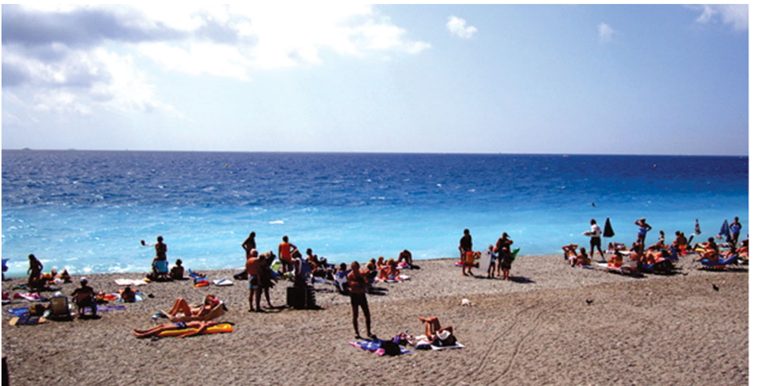
Лазурный берег действительно лазурный

Лазурный берег – действительно то место, где хочется забыть о ежедневных заботах, стать счастливым и беспечным, посидеть в тени оливковых деревьев с бокалом прекрасного французского вина, пробуя деликатесы французской кухни.