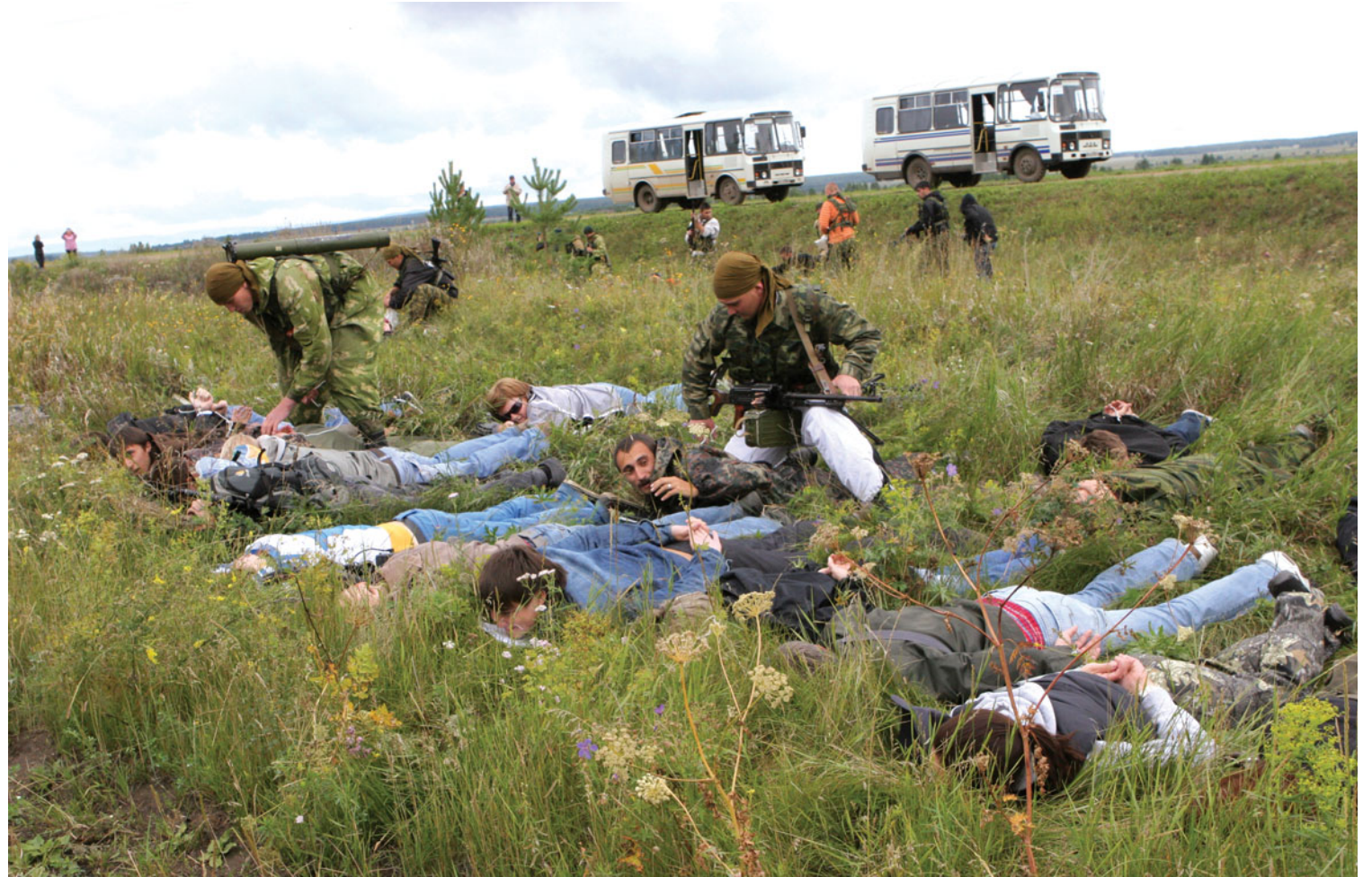
На войне, как на войне: журналисты, попавшие в лапы террористов, учатся выживать

В один из дней организаторы подготовили участникам сюрприз – розыгрыш взятия