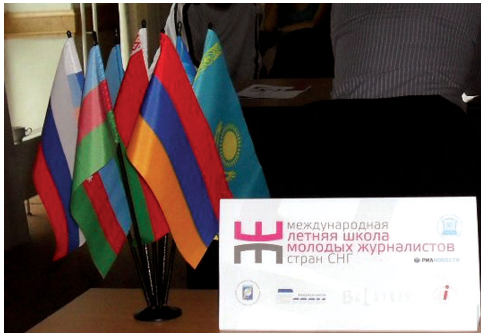
Памятные символы уходящего лета

Ребята из Молдовы тоже прониклись дружественной обстановкой Школы. Вот как от-