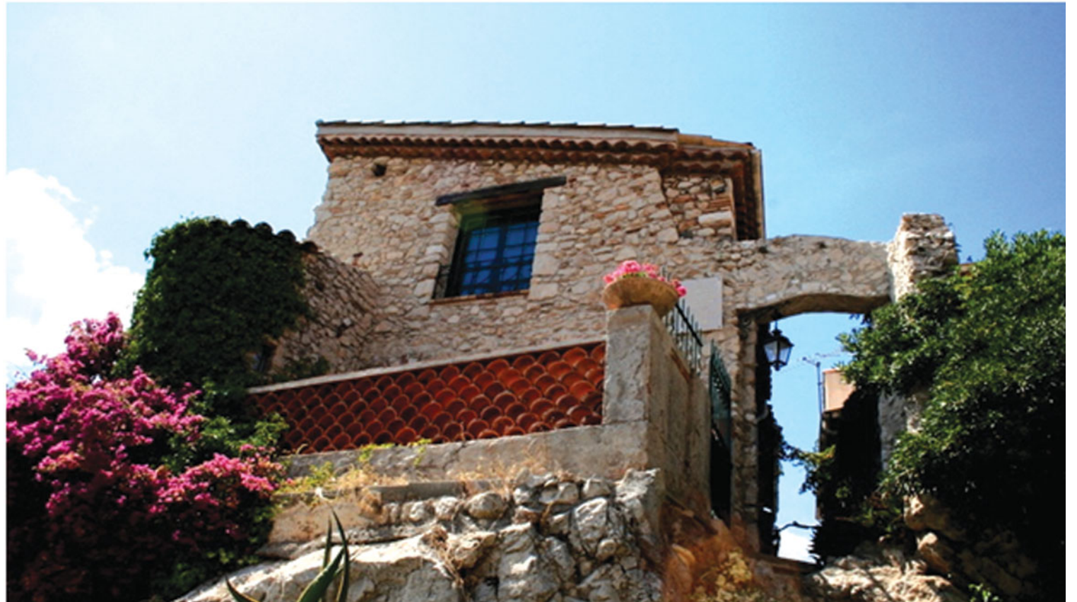
Удивительный уголок Ниццы

В ходе поездки мы посетили также другие города ривьеры: Антибы, Из, Монако и Канны.