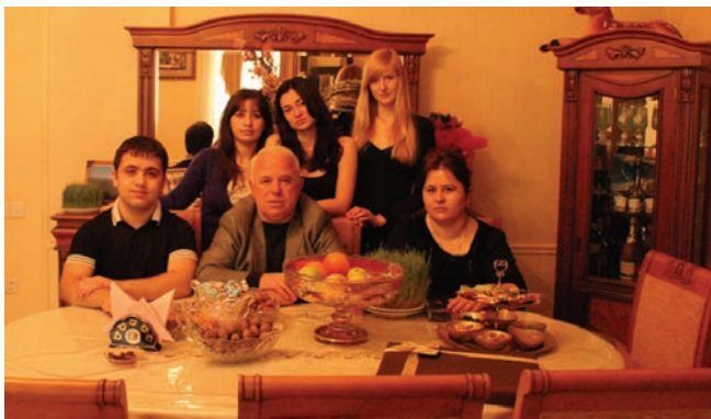
НАША АЗЕРБАЙДЖАНСКАЯ СЕМЬЯ.

Мы увидели также много интересных мест в окрестностях