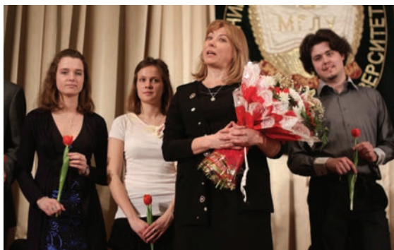
ПОСЛЕДНИЙ АККОРД