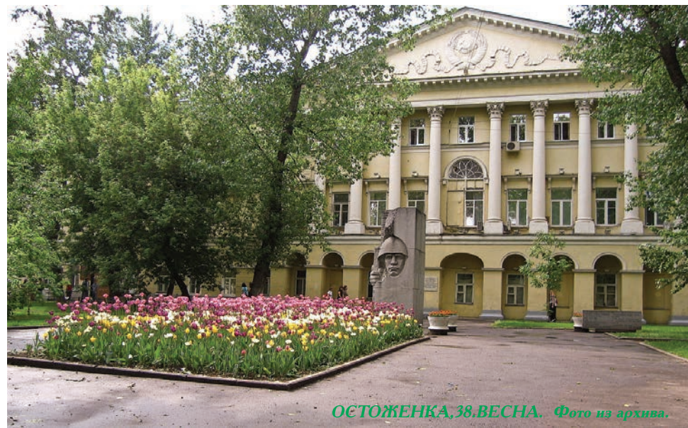
ОСТОЖЕНКА, 38, ВЕСНА.