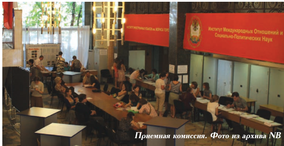
Приемная комиссия.

Сегодня в структуре Университета 11 факультетов и 6 институтов, 79 кафедр, осуществляется подготовка по 25 специальностям и двум направлениям специалистов высшего профессионального образования с углубленным изучением двух иностранных языков. Обучение ве-