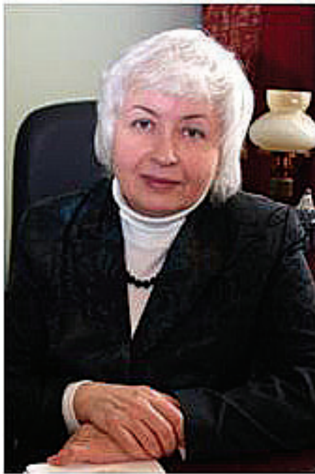
ГОВОРИТЬ О РОДНОМ ФАКУЛЬТЕТЕ ЛЕГКО И ТРУДНО.