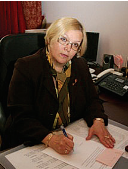
РАБОТА - СОСТОЯНИЕ ОБЫЧНОЕ.

В 1990 году на базе факультета английского языка был создан факультет гуманитарных и прикладных наук, ставший приемником и хранителем его традиций.