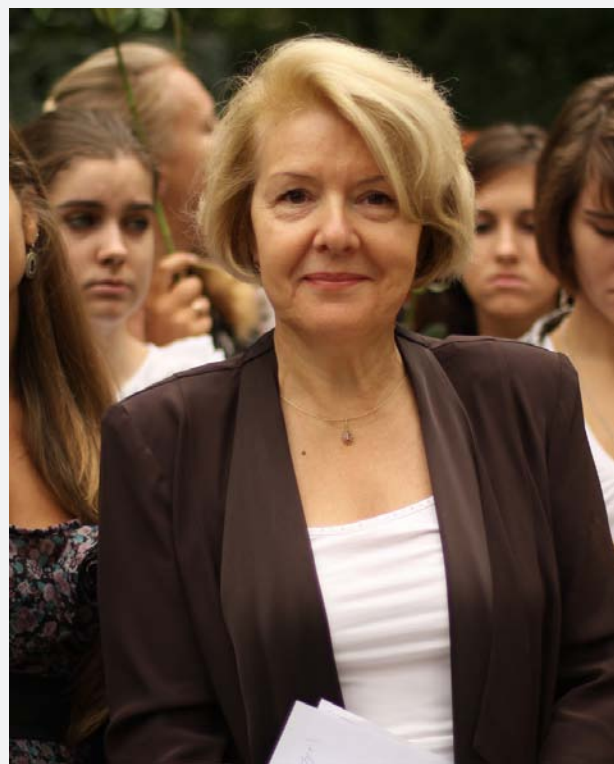
Первого сентября 2011 года.