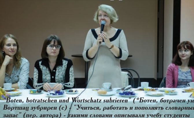
"Boten, botratschen und Wortschatz subrieren" ("Ботен, ботрачен унд Вортшад зубрирен (с) - "Учиться, работать и пополнять словарный запас" (пер. автора) - такими словами описывали учебу студенты старших курсов. И декан с ними солидарна.