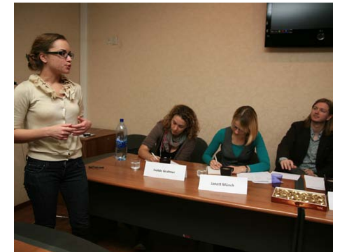
ПОЧТИ КАК В ТЕАТРЕ.

Обратим внимание на то, что все члены жюри конкурса - носители немецкого языка. Они были приятно удивлены тем, что многие участники чита-