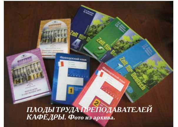
ПЛОДЫ ТРУДА ПРЕПОДАВАТЕЛЕЙ КАФЕДРЫ.

При отборе учебных материалов предпочтение отдаётся аутентичным текстам (как письменным, так и аудиотекстам). Большой