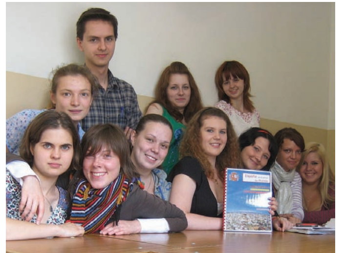
ПОСЛЕ ВТОРОГО ЯЗЫКА МОЖНО ВЗЯТЬСЯ И

С большим интересом студенты участвуют в дискуссиях на самые разнообразные актуальные проблемы. При подготовке проектов студенты обращаются к различным источникам, в том числе к современным мультимедийным средствам. Презентация их проек-