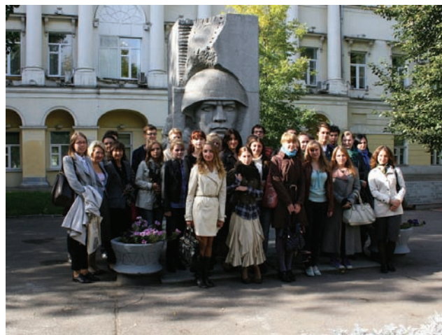
И ПО ТРАДИЦИИ СНИМОК НА ПАМЯТЬ.

темую любви под другим углом, в отличие от общепринятого.